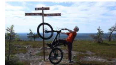
MAASTOPYÖRÄILY, PALLAS-YLLÄSTUNTURIN KANSALLISPUISTO