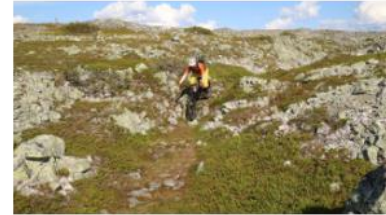
MAASTOPYÖRÄILY, PALLAS-YLLÄSTUNTURIN KANSALLISPUISTO